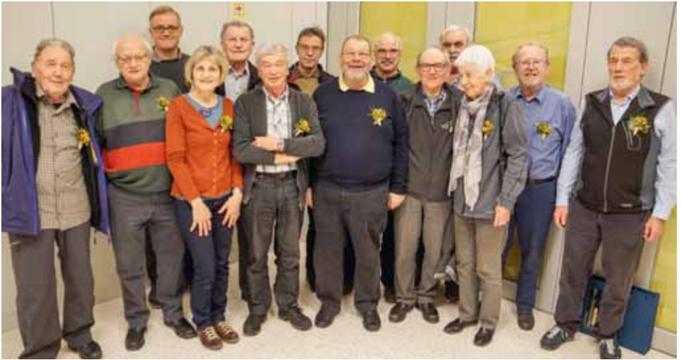
Die «vereinigten» Jubilare