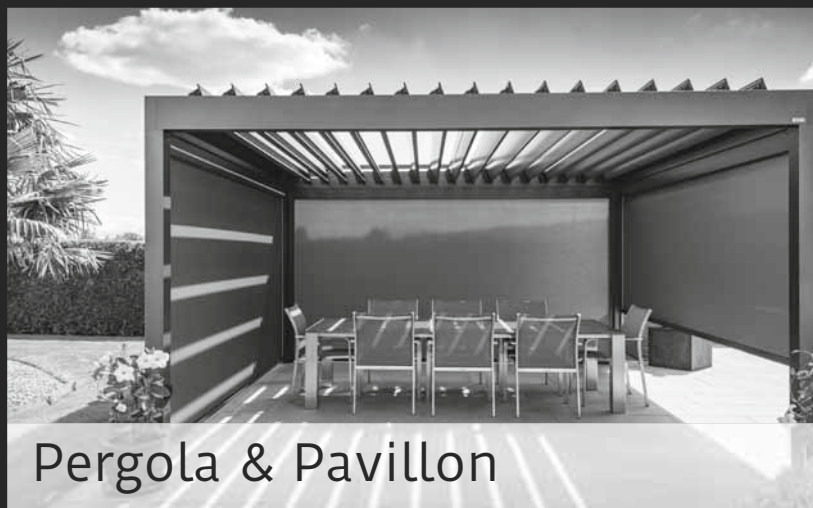
Pergola & Pavillon